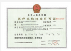
医疗机构执业许可证