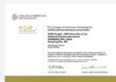
美国病理家协会（CAP）认证证书