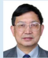
褚嘉祐 博士 研究员、博士生导师 中国医学科学院、北京协和医学院医学生物学研究所教授