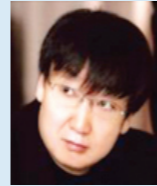
吕有勇 博士 北京大学肿瘤医院教授 北京市肿瘤防治研究所研究员、博士生导师 北京肿瘤分子生物学实验室主任